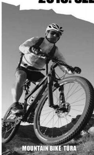
MOUNTAIN BIKE TÚRA