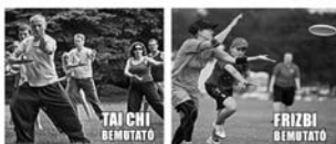
TAI CHI BEMUTATÓ