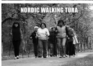
NORDIC WALKING TÚRA