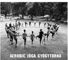
AEROBIC, JÓGA, GYÓGYTORNÁ