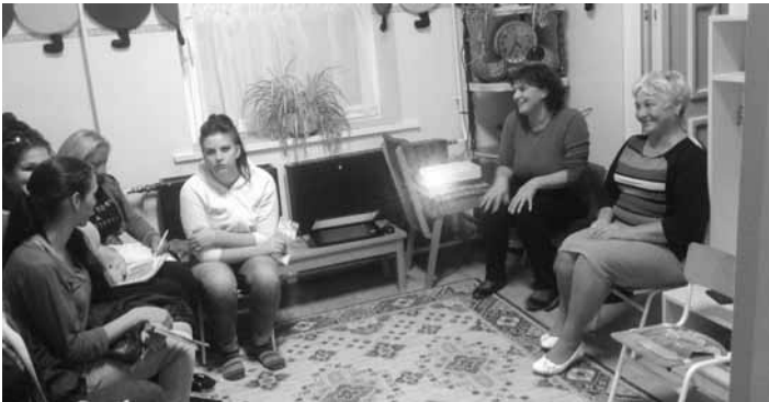
Szülőklub az erdőkövesdi Napközi Otthonos Óvodában

A szabadidős okoseszközhasználat kockázataira érzékenyítő projekt a térségi szakemberekkel, oktatási intézményekkel együttműködésben tovább folytatódik majd és az elképzelések szerint a közeljövőben az országos LEK hálózat is bekapcsolódik majd a munkába, így a preventív lépések hatékonysága megsokszorozhatóvá válik.