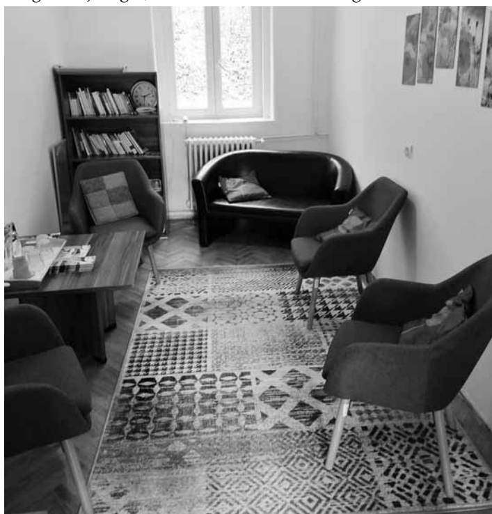
LEK tanácsadó helyiség

A LEK szolgáltatásait, foglalkozásait eddig is ingyenesen vehette igénybe a járás lakossága, és ebben a jövőben sem lesz változás. Kiemelt célcsoportot képviselnek a gyermekeket nevelő családok, melynek tagjait az oktatási intézményeken, munkahelyeken keresztül valamint települési rendezvények