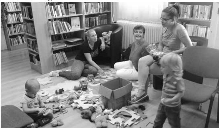
Baba-Mama klub Recskén a Nagyközségi Könyvtárban

Különösen fontos volt, hogy a legkisebb gyermekeket nevelő szülőkkel is fel tudjuk venni a kapcsolatot. Elkötelezett védőnő, települési közművelődési munkatársak által szervezett klubfoglalkozás keretei között részben tematikus előadásokkal, részben személyre szóló tanácsadási lehetőséggel igyekeztünk támogatni az édesanyákat a családi élet, gyermeknevelés számukra fontos kérdéseiben.