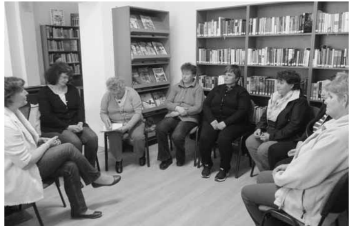
Ismeretterjesztő előadás a fedémesi Könyvtárban

A települések könyvtáraiban, művelődési házaiban, egészségnapok helyszínén rendszeresen szerveztünk ismeretterjesztő előadásokat is a lakosság számára. Változatos témákban igyekeztünk korszerű, a lelki egészségmegőrzést célzó ismereteket átadni a különböző korosztályoknak.