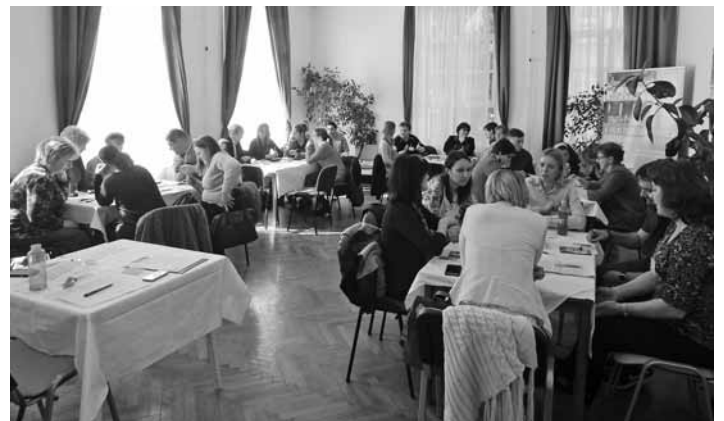
Szakmai nap Parádfürdőn a régiós Lelki Egészségközpontok részvételével