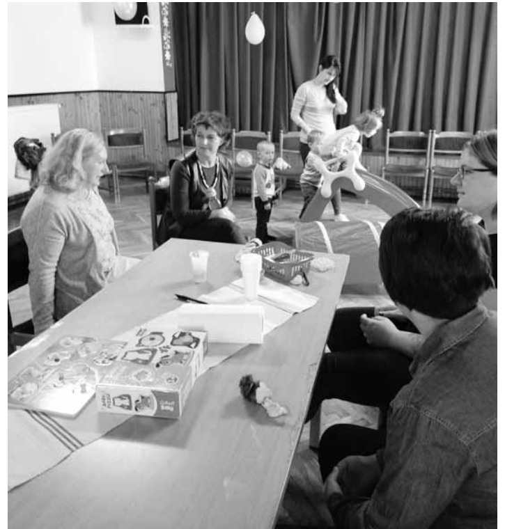
Részvétel a bükkszenterzsébeti Ciróka foglalkozáson

A települések könyvtáraiban, művelődési házaiban, egészségnapok helyszínén rendszeresen szerveztünk ismeretterjesztő előadásokat is a lakosság számára. Változatos témákban igyekeztünk korszerű, a lelki egészségmegőrzést célzó ismereteket átadni a különböző korosztályoknak.