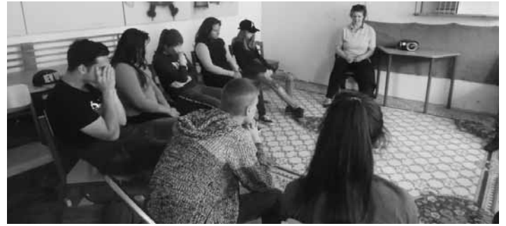
Relaxációs foglalkozás a siroki általános iskolában

Nagy örömünkre szolgált, hogy a térségi egészségügyi, oktatási és szociális ellátó intézmények közül többen is igénybe vették a LEK tevékenységeit, elősegítve ezzel dolgozóik kiegészítési tevékenységét.