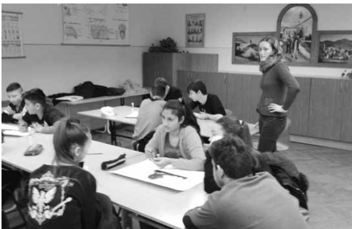
Életkészség javító iskolai foglalkozás Mátraderesckén

A gyerekek számára több alkalmas életkészség javító foglalkozássorozatot fejlesztettünk ki, melynek keretében eddig elsősorban a 8. osztályos diákokat igyekeztünk bevonni a család és az emberi kapcsolatok jelentőségét megvitató, egészséges értékrend és jövőkép kialakítását célzó, a pénzgazdálkodás alapjaival ismerkedő, reális testképet és önértékelést építő, családi és párkapcsolati kérdéseket érintő beszélgetésekbe.