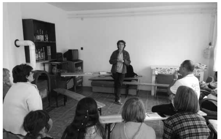
Ismeretterjesztő előadás Váraszón