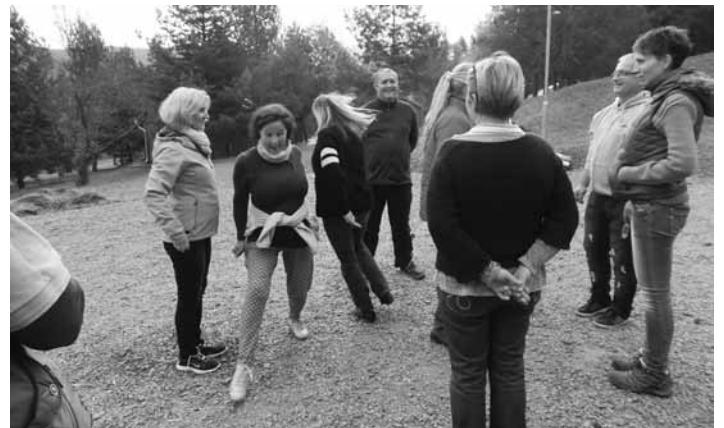
Kiegészítési csoportfoglalkozás a PÁK dolgozóinak

2019. 03. 28-án és 2019. 11. 20-án 2 alkalommal került sor szervezésünkben olyan szakmai találkozóra, melynek célja volt a Észak-Kelet Magyarországon működő Lelki Egészségközpontok tapasztalatcseréje, működési gyakorlatának összehangolása, jó gyakorlatok összegyűjtése.