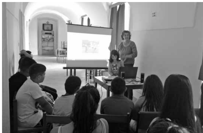
Gyermekfoglalkozás a recski Karitás nyári táborában

képet alkossanak a korosztály életvezetési szokásairól, ezen belül elsősorban a szabadidős okoseszközhasználat káros következményeiről. Ez a felmérés szolgált kiindulópontként egy olyan prevenció projekt elindításához, amelynek célja, hogy elsősorban a szülők, de maguk az érintett gyerekek is információkat kapjanak a túlzásba vitt "kütyözés" veszélyeiről (ilyen például a függő magatartás kialakulása).