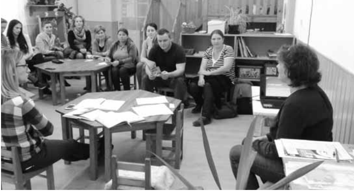
Szülőklub a Mátraballai Csodaszarvas Óvodában

sű információs anyagot (tematikus hírlevél és szóróanyag) hoztunk létre a lakosság számára. Ezeket az eredményeket az oktatási intézményekkel együttműködve szülői értekezletek (Szülőklubok) keretein belül igyekeztünk megismertetni a családokkal is.